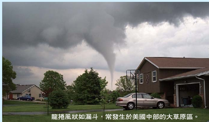
龍捲風狀如漏斗，常發生於美國中部的大草原區。

今天世界上的龍捲風，幾乎都發生在美國中部的大草原區，規模可觀的每年可統計到上千次，多發生在春、夏季白天。大型的直徑約數百公尺，移行速度每小時數十公里，從產生到消逝多不過半小時；定點遭風襲的時間，前後不到一分鐘。旋轉風速估計最高可達每小時400-500公里，超過颱風最高風速一倍！最恐怖的紀錄，是1925年3月18日，美國中部一個寬達兩公里、移行時速100公里的特大龍捲風，橫行穿越三州、400公里，數小時之內奪走689條人命！另一次是1974年的4月，兩天之內，在幾