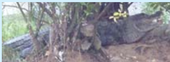
中國揚子鱷古名鼉（音駝），身小性溫，圖為成年雄鼉在樹叢裡偃寢（攝於湖北宜昌中華鱗研究所）。

今天世界上有20多種鱷，居熱帶及亞熱帶水澤地區，南亞洲、印、馬、北澳洲海畔都有，非洲大陸，中、南美洲沿海及各島也有，基本上大多屬長吻鱷（crocodile）。今天的